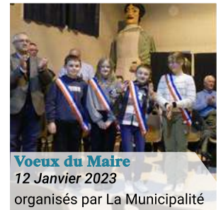
Voeux du Maire 12 Janvier 2023 organisés par La Municipalité