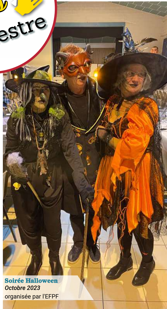
Soirée Halloween Octobre 2023 organisée par l'EFPP