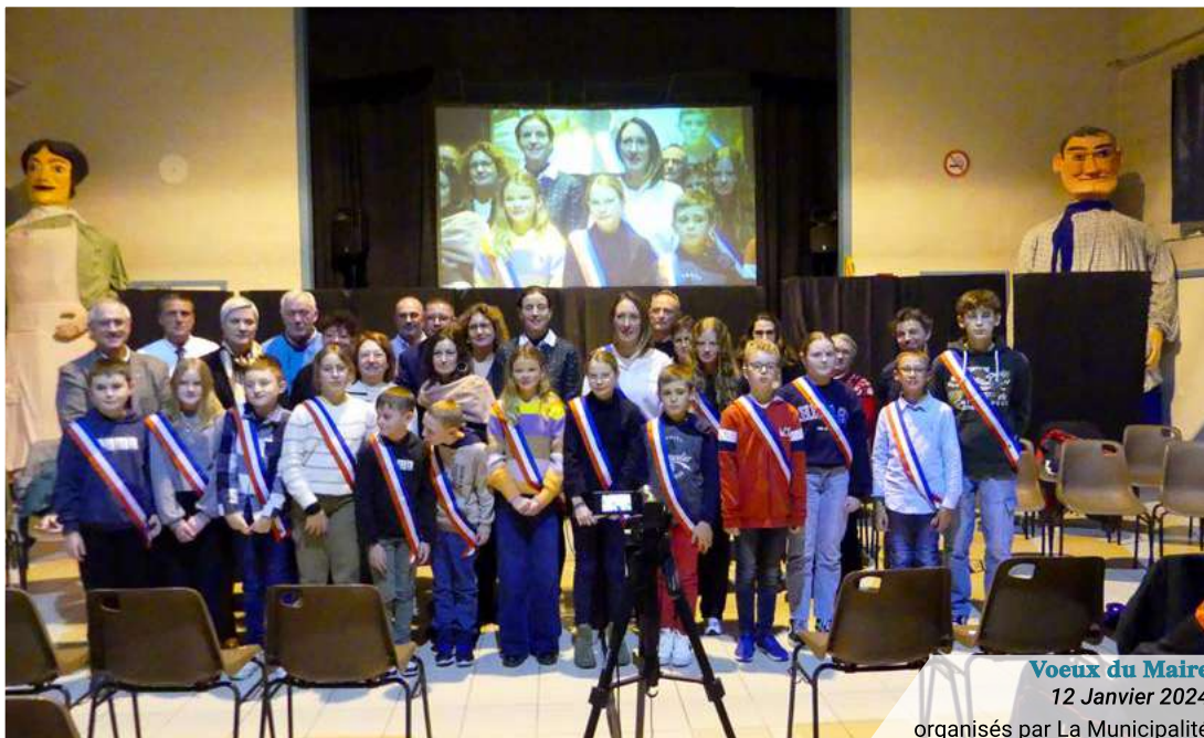
Voeux du Maire 12 Janvier 2024 organisés par La Municipalité