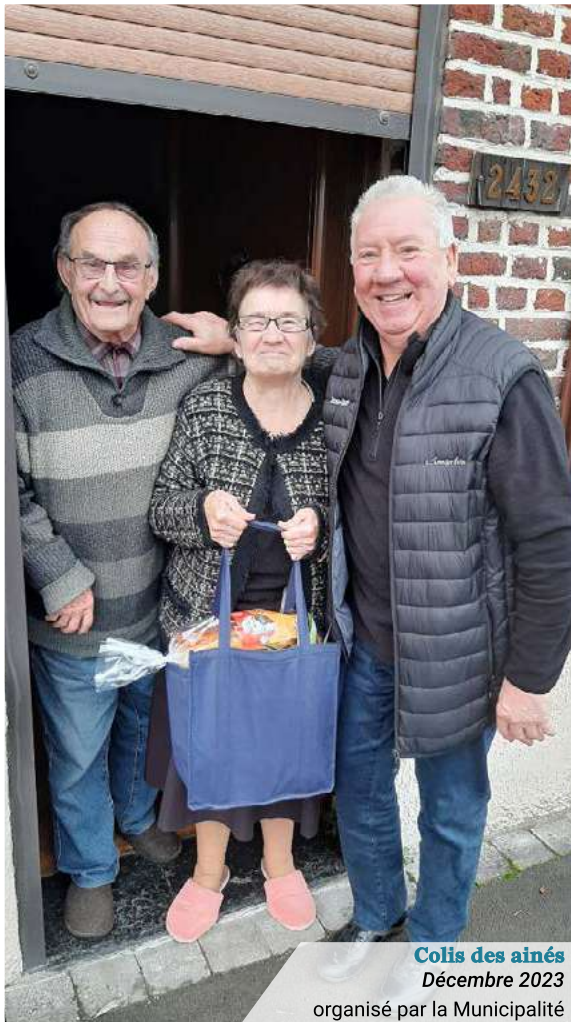
Colis des aînés Décembre 2023 organisé par la Municipalité