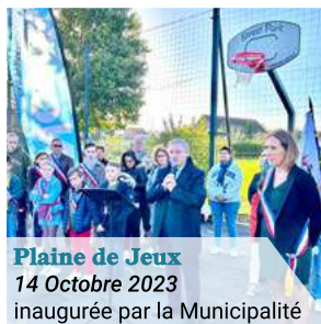
Plaine de Jeux 14 Octobre 2023 inaugurée par la Municipalité