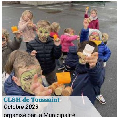
CLSH de Toussaint Octobre 2023 organisé par la Municipalité