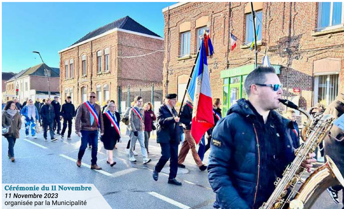
Cérémonie du 11 Novembre 11 Novembre 2023 organisée par la Municipalité