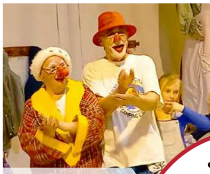
Goûter des enfants Décembre 2023 organisé par l'ESGF et Les Archers Faumontois