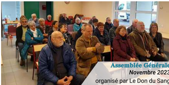
Assemblée Générale Novembre 2023 organisé par Le Don du Sang