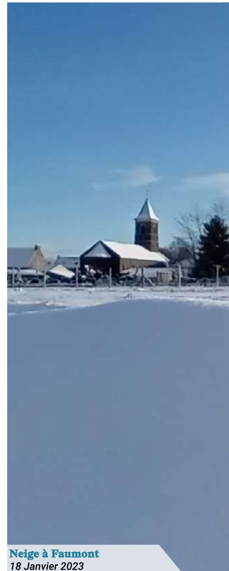
Neige à Faumont 18 Janvier 2023