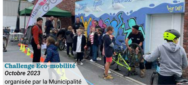
Challenge Eco-mobilité Octobre 2023 organisée par la Municipalité