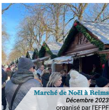
Marché de Noël à Reims Décembre 2023 organisé par l'EFPP