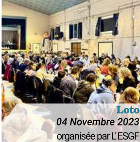
Loto 04 Novembre 2023 organisée par L'ESGF