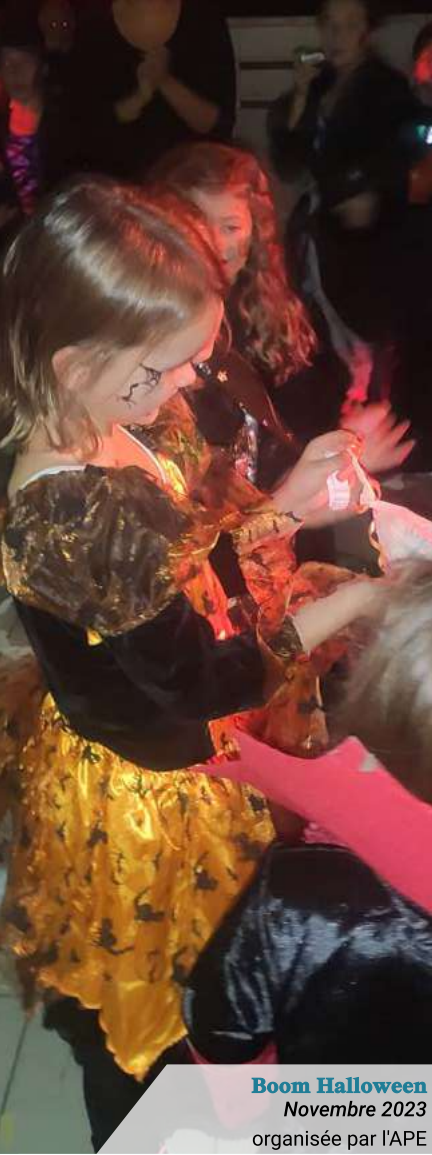
Boom Halloween Novembre 2023 organisée par l'APE