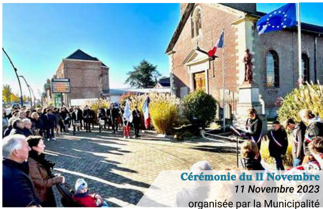
Cérémonie du 11 Novembre 11 Novembre 2023 organisée par la Municipalité