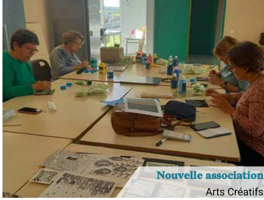
Nouvelle association Arts Créatifs