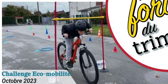
Challenge Eco-mobilité Octobre 2023