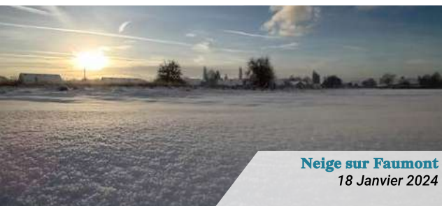
Neige sur Faumont 18 Janvier 2024