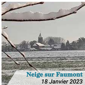
Neige sur Faumont 18 Janvier 2023