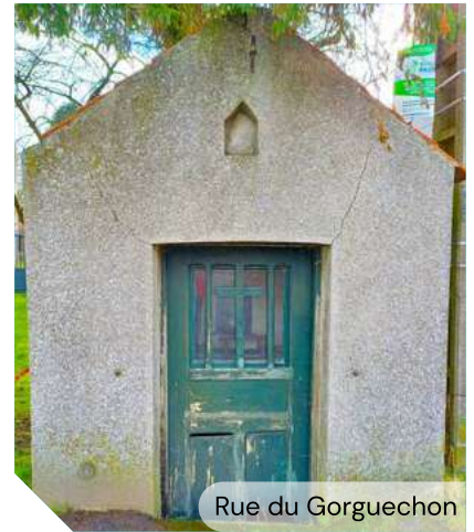
Rue du Gorguechon

La commune souhaite remettre en état les chapelles du village situées route Nationale, rue Verte et rue du Gorguechon.