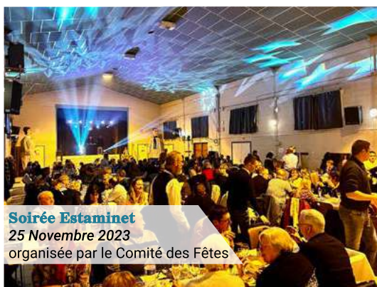
Soirée Estaminet 25 Novembre 2023 organisée par le Comité des Fêtes