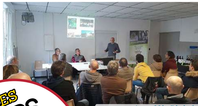
Assemblée Générale le 30 Novembre 2023 organisée par Le Vélo Club Faumontois